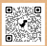
申し込みフォーム

駐車台数が限られておりますので、出来るだけ公共交通機関または乗り合わせでお越し願います。