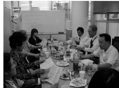
みんなで和気あいあいと情報交換！

共同事務所内の取り決めが必要な時、新しい団体の入居や卒業団体があつた時、また年末年始など、入居団体のスタッフが集まって、「寄合」を開催しています。それぞれの団体でどんな活動を行っているのか紹介したり、近況を報告し合ったり、団体間のつながりを深める場となっています。